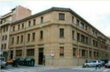
Instituto de Salud Pública