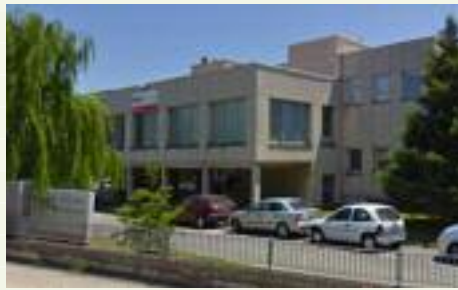
Instituto de Salud Laboral