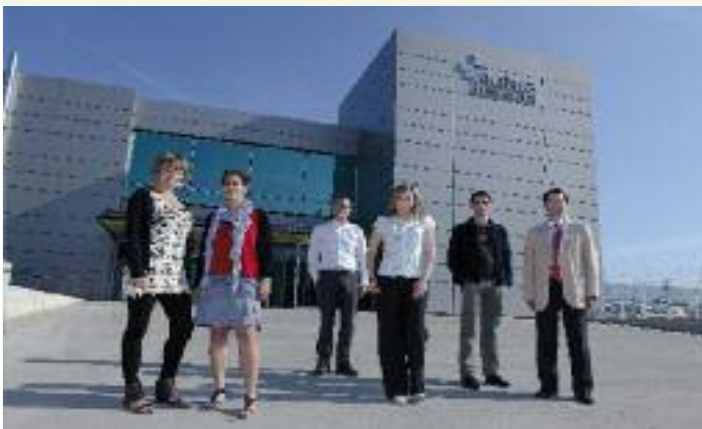
Los encargados de las campañas de Lizarte, SOS Navarra, Anapeh, Cementos Portland y Colegio Irabia-Izaga en Landaben.

■ ‘La Gran Recogida Navarra’ es la campaña del Banco de Alimentos de Navarra (BAN), que reúne las provisiones donadas por los ciudadanos en las superficies comerciales para repartirlas entre las personas que más las necesitan. Voluntarios de todas las edades han estado presentes en híperes y supermercados durante los días 8 y 9 de junio con ese objetivo. Sin embargo, algunas empresas asociadas a Mutua Navarra no han podido esperar y han realizado su particular recogida interna durante los