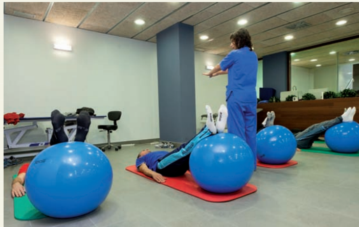
Pacientes del grupo de rehabilitación postural.

Los grupos de ejercicios RHB, que comenzaron el pasado mes de mayo, se estructuran en tres clases semanales de cincuenta minutos cada una, durante una media de veinte días. En ellas se realizan estiramientos, ejercicios de fortalecimiento y correcciones posturales. El objetivo es que los alumnos los “interioricen y aprendan correctamente para que al realizarlos en casa, no cometan errores”, afirma Hele-