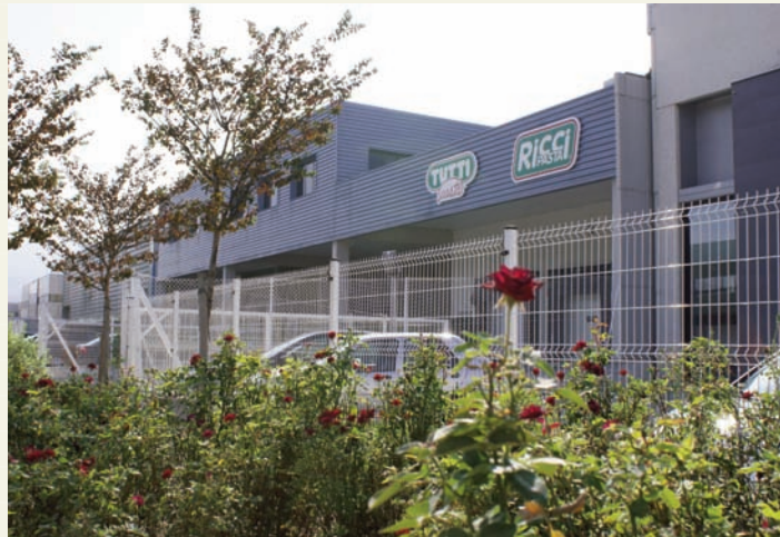
Exterior de las instalaciones de Tutti Pasta en Esquíroz.