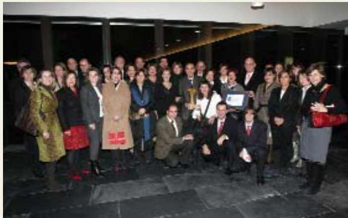
Representantes de San Cernin posando con el Premio Navarro a la Excelencia.

¿Cómo se valora la salud laboral en el colegio? "Tenemos en cuenta los diferentes grupos en los que se encuadra el personal. Para el personal no docente existen cursos de prevención y formación, ya que se manejan sustancias tóxicas, como los productos de limpieza, o se manejan cargas pesadas, por ejemplo en mantenimiento". ¿Y el personal docente? "Los profesores pasan revisiones médicas, y también se