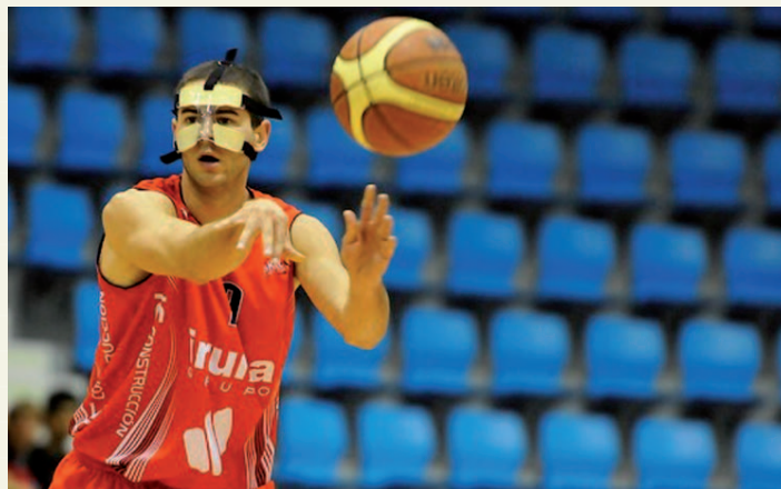
Un jugador se protege con una máscara. BASKET NAVARRA CLUB.

¿Creéis que es importante llevar un estilo de vida saludable?